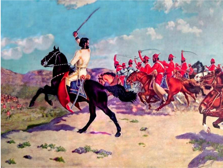
Carga de Güemes y sus Infernales" Óleo sobre tela de Juan A. Boero.

Guerra de la independencia en el norte del Virreynato del Río de la Plata: Güemes y el Norte de Epopeya, Volumen I de Alberto Cajal, pagina 403.