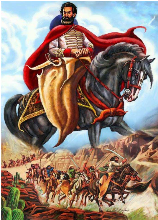
Güemes en Combate de Rodolfo Riquelme

y lanzadores) como así también recuperan los caballos y vacunos que los invasores habían juntado en su trayecto. Destrozando por completo esa partida enemiga. (Güemes Documentado Tomo 2 pag. 142) Como pudimos ver este sería uno de los muchos combates en los que el Gral. Güemes luchó cuerpo a cuerpo contra los enemigos y el accionar de los gauchos que le seguían sería felicitado expresamente por el