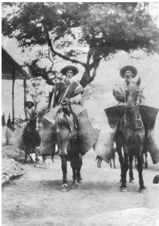
Últimos Gauchos de Güemes en la década de 1880.

Dorrego de Lily Sosa de Newton, pagina 59.