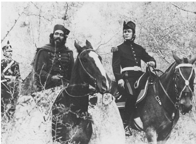
Güemes y San Martín escena de la Película el Santo de la Espada

17)---- El 9 de marzo de 1814: Fuerzas patriotas del ejército mandado por Martín Miguel de Güemes, derrotaron al Capitán Saturnino Castro, realista, en el Valle de Lerma. “Don Pedro José de Zabala da una guerrilla que tuvo el 9 del corriente en el Carril del Bañado con una partida enemiga de diez hombres, de los que hizo 4 prisioneros, y les tomo siete fusiles, e hirió al comandante y otros más que lograron escapar ”